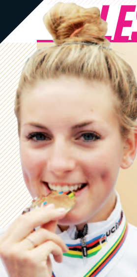
Pauline FERRAND PREVOT

CHAMPIONNE DU MONDE ROUTE ELITE CHAMPIONNE D'EUROPE ESPOIR VTT CROSS-COUNTRY OLYMPIQUE